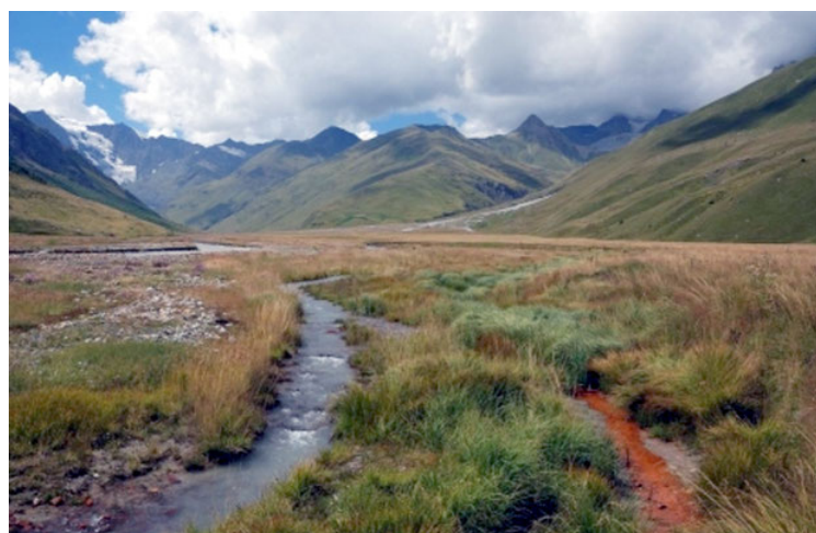
Горно-болотный комплекс Чифандзар.