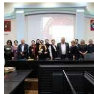
Дагестанский госуниверситет, г.Махачкала, Республика Дагестан (copy-past)