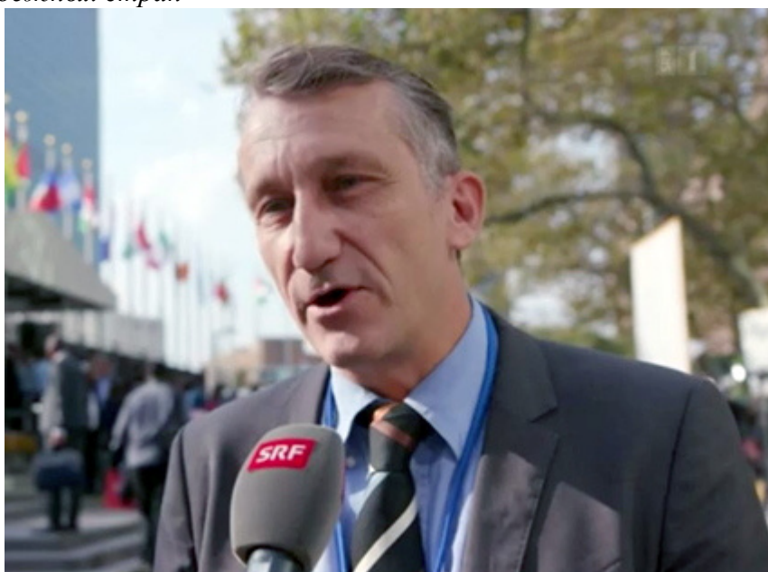
Саммит ЦУР 2019, Генеральная Ассамблея ООН, Нью-Йорк, США